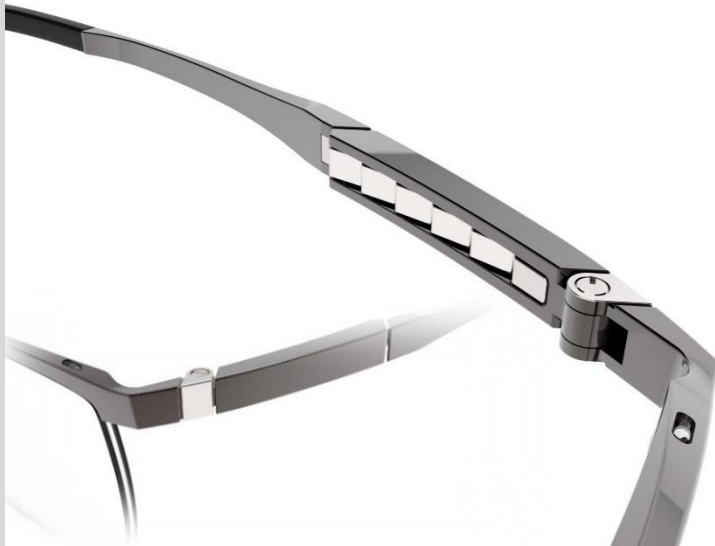
ZT27073 / ZT27074

Atractivo y con estilo, la montura de aro completo tiene una forma rectangular fresca que crea un acento distintivo en la cara. Las varillas son flexibles gracias a un núcleo de titanio Z y expresan un ambiente vintage que las distingue de la multitud. Las atractivas selecciones de colores y el logotipo Z grabado completan este estilo elegante.