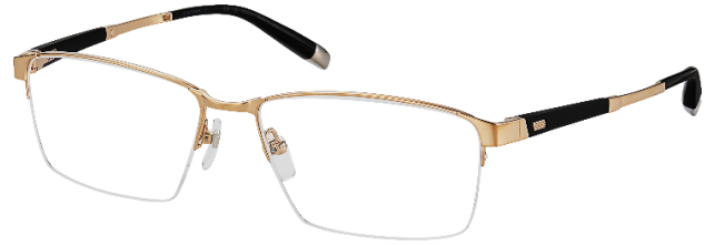
ZT27071 / ZT27072

Esta hermosa montura CHARMANT Z es un testimonio del estilo de diseño moderno y la ingeniería de vanguardia de las gafas. Las varillas cuentan con una construcción ensartada de piezas de titanio y resina con un núcleo de titanio Z para un ajuste óptimo.